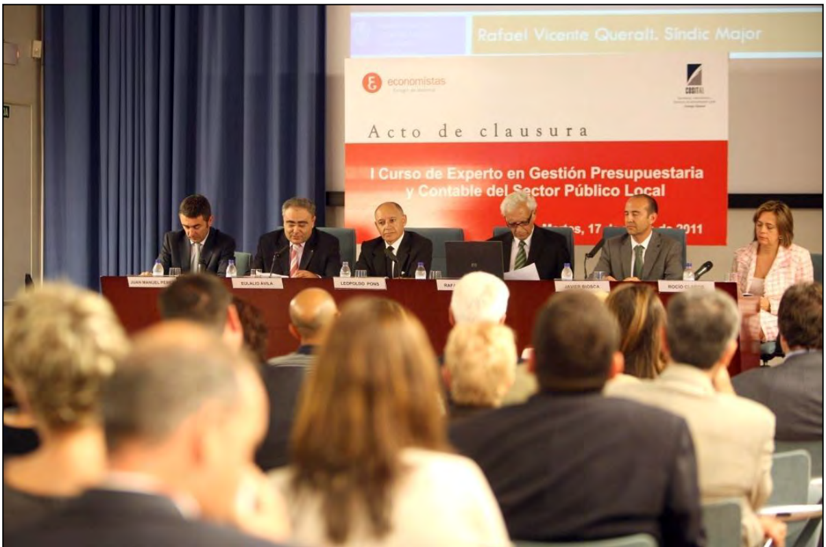
Acto de Clausura de la edición de Valencia.

Con dos ediciones, una en el Colegio de Economistas de Málaga que dio comienzo y fin en 2010 y otra en el Colegio de Economistas de Valencia, El curso que contó con 34 alumnos, se inició el 15 de octubre de 2010 y se clausuró el 25 mayo de 2011